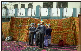
Little stars of Oriental singing a Poem