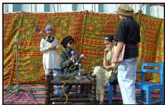
Girl Students Performing a skit