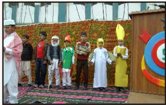
A Tableau Presentation