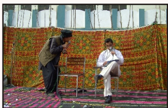
Boy Students in different roles in a skit