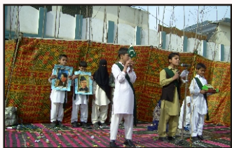
A Tableau Presentation